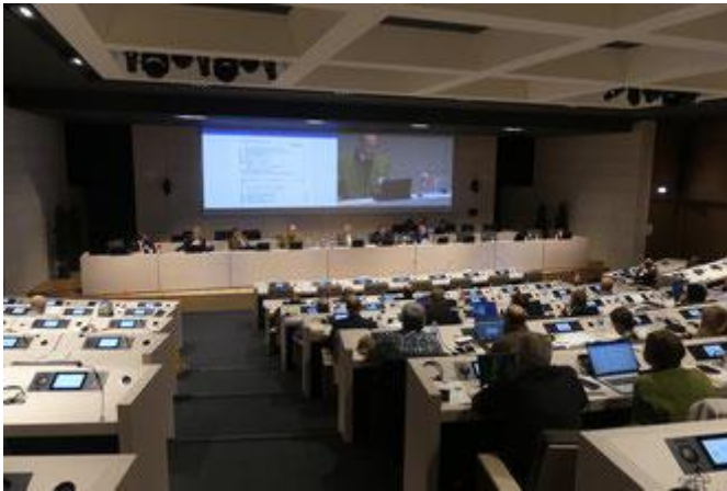
Conférence lors du congrès UEF de Chartres.

EFA-CGC a organisé du 29 septembre au 3 octobre dernier le 20 ème congrès de l'Union européenne des forestiers (UEF) dont il est membre. Retrouvez toutes les informations sur ce temps fort d'échanges entre forestiers de 21 pays autour de la future stratégie forestière européenne sur notre site .